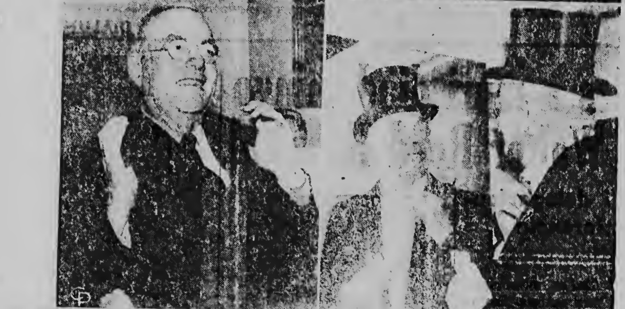
DULLES NO.OFICIAL. — E tres fotonan aki ta mustra John Foster Dulles, kende a muri diadomingo den su sonjo, na hospital, no-oficial durante su carera diplomatico...